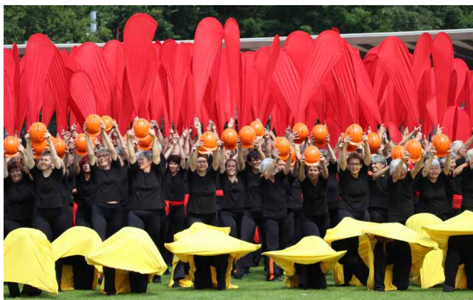
Farbig und imposant – die Schweizer Grossgruppe begeistert im Casino Stadion Bregenz.

Strahlende Gesichter, packende Musik und mitreisende Darbietungen. Die Grossgruppenvorführungen vom Dienstag, 9. Juli 2019 im Casino Stadion von Bregenz waren ein farbiger Höhepunkt der diesjährigen Gymnaestrada-Woche im Vorarlberg. Rund 3500 Turnerinnen und Turner aus neun verschiedenen Nationen bildeten den gestrigen Grossgruppen-Nachmittag – von Tschechien über Finnland bis Deutschland, die Turnfans kamen während rund drei Stunden voll auf ihre Kosten. Mittendrin und mehr als einfach nur dabei waren auch die über 600 Turnenden aus der Schweiz, die mit ihrer Grossgruppe die hunderten von Zuschauerinnen und Zuschauer auf den Tribünen während mehr als 20 Minuten zu begeistern wussten.