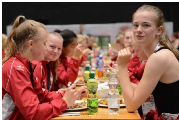
Guten Appetit: Das Essen schmeckt.

Der Gymnaestrada-Alltag gibt Hunger. Mit der Riege herumlaufen, Schritte sammeln, seine Turnkünste auf der Bühne vor grossem, internationalem Publikum zeigen und und und. – Das alles zusammen ergibt grossen Hunger. Dieser will gestillt sein: er wird gestillt. Zu jeder Akkreditierung wurden sieben Essens-Bons abgegeben (Wert 113 Franken). Diese können auf dem Messegelände, Halle 11,